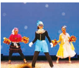
東陽 - ハロー ミスター モンキー