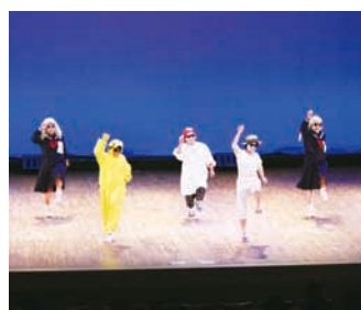
太田郷 - パーフェクト ヒューマン