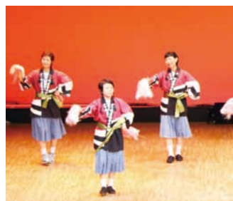
千丁 - サンバ de JK