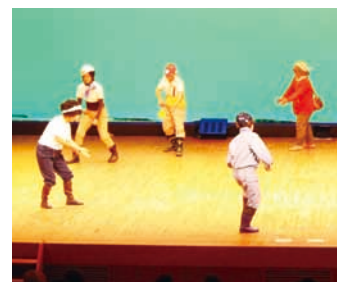
坂本 - 炭坑節