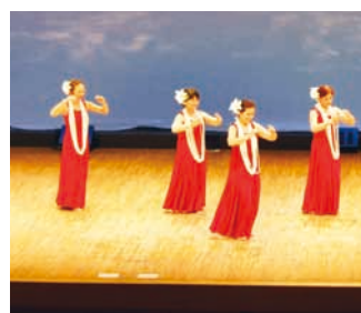
鏡 - カノホナ ビリカイ