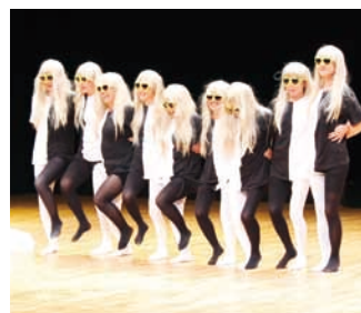
北新地 - ?ダンス