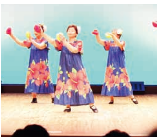
松高 - 上海の花売り娘