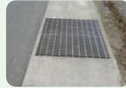
◀側溝のグレーチング部分